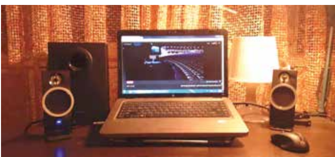
روزبه نعمت‌اللهی برای طرفدارانش کنسرت آنلاین برگزار کرد

برنامه‌های فرهنگی و هنری حداقل تا اواسط بهار ادامه خواهد داشت. بنابراین این موضوع را می‌توان از دو جنبه بررسی کرد، نخست درآمد هنرمندان است که با تعطیلی مراکز فرهنگی و هنری بالطبع درآمدی نخواهند داشت که به نظر من این موضوع باید در اولویت دوم قرار بگیرد چرا که تعداد هنرمندان به نسبت تعداد کل جمعیتی که پیرامون ما بوده خیلی کمتر است بنابراین اگر همه جامعه ما در چنین بحرانی قرار گرفته و با آن دست و پنجه نرم می‌کنند و توقع دارند دولت از آنها حمایت کند، به‌تبع این انتظار وجود دارد که دولت با خانواده‌های خود درصد درآمد فروش بلیت کنسرت‌ها در سال گذشته و حمایت‌های خود این‌خا را جبران کند. اما بخش دوم که به اصطلاح بخش معنوی این موضوع است تعطیلی و عدم اجرای برنامه‌های هنری و فرهنگی است که تأثیر جدی بر روحیه جامعه داشته است و لازم است روی این بخش بررسی بیشتری صورت بگیرد. با توجه به این موضوع و طبق پیشنهاد صنفی ناشران موسیقی تصمیم بر آن است که از دوم فروردین ماه