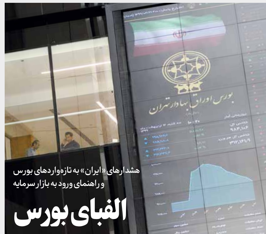
هشدارهای «ایران» به تازه‌واردهای بورس و راهنمای ورود به بازار سرمایه