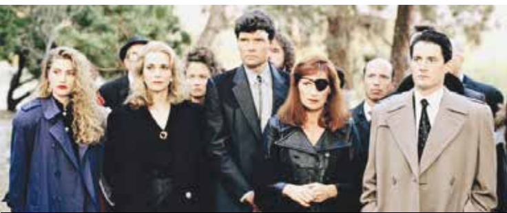
«توین پیکن» (Twin Peaks)

● ژانر: جنایی و درام پر راز و رمز ● کمپانی‌های سازنده: لینچ فراسنت پرو داکشنز، پروپا گاندا فیلمز و شوتایم ● خالقان: دیوید لینچ و مارک فراسنت ● بازیگران اصلی: کایل مک لاکلان، مایکل انتکین، مد چن آمیک، دانا اشبروک، ریچارد بیمر، لارا فلین بویل، شریلین فن، وارن فراسنت، یگی لیپتون، جیمز مارشال، اوه رت مک گیل، جک نانس و پایپر لوری ● موسیقی متن: آنجلو بادالامنتی ● تعداد فصل‌ها: ۳/ ● شمار اپیزودها: ۴۸ ● زمان بخش: آوریل ۱۹۹۰ تا ژوئن ۱۹۹۱ و مه تا سپتامبر ۲۰۱۷ ● موضوع: این کار سوررئال به سبک و سیاق تمامی آثار سینمایی دیوید لینچ، یک اثر هنری کاملاً لینچی و در نوع خود بی نظیر است و هواداران بسیاری دارد که همیشه از شیوه کار و نوع داستان گویی پر راز لینچ و ابهام‌ها و چیستان‌ها و آدم‌های غیر متعارف قصه‌های