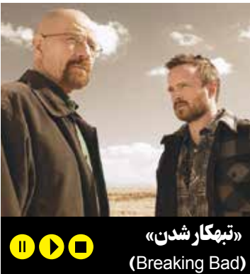
«تبهکار شدن» (Breaking Bad)

● ژانر: جنایی و درام پر راز و رمز ● کمپانی‌های سازنده: لینچ فراسنت پرو داکشنز، پروپا گاندا فیلمز و شوتایم ● خالقان: دیوید لینچ و مارک فراسنت ● بازیگران اصلی: کایل مک لاکلان، مایکل انتکین، مد چن آمیک، دانا اشبروک، ریچارد بیمر، لارا فلین بویل، شریلین فن، وارن فراسنت، یگی لیپتون، جیمز مارشال، اوه رت مک گیل، جک نانس و پایپر لوری ● موسیقی متن: آنجلو بادالامنتی ● تعداد فصل‌ها: ۳/ ● شمار اپیزودها: ۴۸ ● زمان بخش: آوریل ۱۹۹۰ تا ژوئن ۱۹۹۱ و مه تا سپتامبر ۲۰۱۷ ● موضوع: این کار سوررئال به سبک و سیاق تمامی آثار سینمایی دیوید لینچ، یک اثر هنری کاملاً لینچی و در نوع خود بی نظیر است و هواداران بسیاری دارد که همیشه از شیوه کار و نوع داستان گویی پر راز لینچ و ابهام‌ها و چیستان‌ها و آدم‌های غیر متعارف قصه‌های