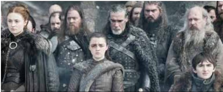
«بازی تاج و تخت» (Game of Thrones)

● ژانر: دراماتیک، تخیلی و تاریخی ● کمپانی های سازنده: گروک و برادران وارنر ● خالقان: دیوید بنیوف و دی بی وایس، براساس رمانی از جورج آر آر مارتن ● بازیگران اصلی: شون بین، مارک آدی، نیکولای کاستر والدو، میشل فیبرلی، لنا هیدی، امیلیا کلارک، ایان گلن، کیت هرینگتون، سوفی ترنر و میسی ویلیامز ● موسیقی متن: رامین جوادی ● تعداد فصل ها: ۸/ ● شمار اپیزودها: ۷۳ ● زمان پخش: از آوریل ۲۰۱۱ تا مه ۲۰۱۹ ● موضوع: این مجموعه در درجه اول در ایرلند شمالی و بخش هایی دیگر از بریتانیا و در درجات بعدی در کشورهای همچون کانادا، کرواسی و ایسلند تصویربرداری شده و در متن داستان به سرزمین هایی خیالی به نام های وستروس و اسوس به عنوان محل شکل گیری اتفاقات اشاره شده است. در طول سریال چند قصه به طور همزمان ترسیم می شوند. یکی