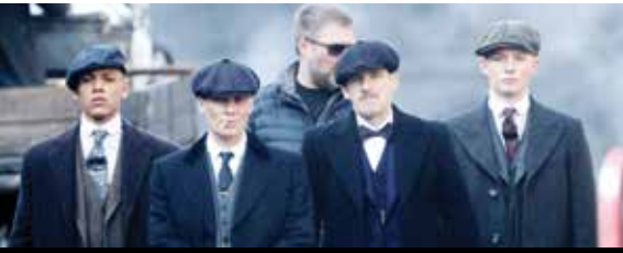
«پیکي بلايندرز» (Peaky Blinders)

سریال های تلویزیونی خارجی که از قریب به ۵۵ سال پیش با آثاری چون «محلہ بیتون» و «روزهای زندگی» نفوذ زیادی در جوامع جهانی یافتند و سپس با امثال «دالاس» دهه ۱۹۸۰ را قبضه و با سینما رقابت پایاپای کردند، طی یک ربع قرن اخیر با شمار تازهای از مجموعه قلب هنر دوستان را نشانه گرفته‌اند. «Miami Vice» و «دوستان» از جمله سریال های موفق دهه ۱۹۹۰ و اوایل دهه ۲۰۰۰ بودند و «ER» نیز همین طور و شاید آنها وادار «فرشتگان چارلی»، «کلمبو»، «مرد شش میلیون دلاری» و پیش از آنها «پرونده های راکفورد»، «گمشده در فضا» و البته «سفر ستاره ای» (در ایران با نام «پشتازان فضا») بودند که همچون جاده بازکن برای مجموعه های چند نسل بعدی عمل کردند. در دهه ۱۹۶۰ وسترن هایی مثل «دود اسلحه»، «ماوریک» و «بونانزا» و البته «روهاید» امثال جیمز کازنر و کلینت ایست وود را به سینما معرفی کرده بودند و از درون مجموعه های دهه ۱۹۷۰ نیز افرادی مانند پیتر فالک، تلی ساوالاس، پیتر گریوز و گای همیلتون سر بر آورده بودند و البته نظایر لئونارد نیموی، مارتین لاندو، رایان اونیل، ویلیام شاتنر و مایکل لاندون نیز غول های کوچکی بودند که در مدیوم تلویزیون رشد کردند و سپس در سینما درخشیدند و این تعریف حتی برای جورج کلونی نیز صدق می کند. تفاوت بزرگی که در سریال های موفق ۲۰ تا ۲۵ سال اخیر نسبت به گذشته به وجود آمده، سرعت و شتاب هر چه بیشتر برای ضربه زنی به بیننده ها در حالت های اضطراری و در قالب داستان هایی فضایی، ماوراء الطبیعه یا جنایی است و دنیا اینک با مجموعه هایی روبه رو است که حتی