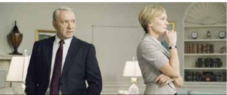
«خانه پوشالی» (House of cards)

● ژانر: دراماتیک، جنایی و معمایی ● کمپانی‌های سازنده: جان گولدوین پروداکشنز، کلاید فیلپس CBS ● خالقان: جف لیندسی و جیمز مانوس جونیور ● بازیگران اصلی: مایکل سی‌هال، جولیا بنز، جنیفر کارینتر، اریک کینگ، لورن ولز، دیوید زایاس، جیمز ریمار، سی‌اس‌ای، درموند هرینگتون و جف پی‌رسون ● موسیقی متن: رالف کنت ● تعداد فصل‌ها: ۸/ ● شمار اپیزودها: ۹۶ ● زمان بخش: از اکتبر ۲۰۰۶ تا سپتامبر ۲۰۱۳ ● موضوع: وقایع این مجموعه متمرکز بر شخصیتی به‌نام دکستر مورگان است که در مطالعه‌روی محلول‌های خونی و همکاری در این زمینه با پلیس به قصد حل معماهای پلیسی متخصص است ولی او ابواقع جوانی دو شخصیتی است و هویت دوم و واقعی‌تر و تلخ‌تر وی قاتلی سریالی است اما نه جنایتکاری که هرکسی را زخمه‌آدم‌های خوب را بکشد بلکه فردی که با تعقیب کردن اشرار و تبهکاران