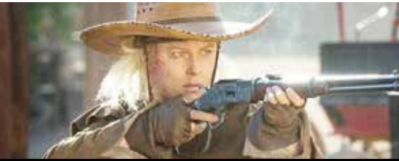
«دنیای غرب» (West world)

وقتی نمی‌درخشند و حداکثر دوسیزون (فصل) پیش می‌روند طبق برآوردهای اقتصادی و محاسبات مالی داخلی استودیوها موفق ظاهر می‌شوند و نه فقط پول خود را پس می‌گیرند بلکه چیزی را هم بر آن می‌افزایند. این مجموعه‌ها با داستان‌های ساده و نوام با نقشه‌های تروییستی یا وضعیت‌های حاد و گرهِ‌های بین‌المللی خود، بینندگان را به فضایی تنیده از آشوب‌ها و خطرات وارد می‌کنند و از این طریق مردم را طی فصل‌ها و اپیزودهای متعدد با سرنوشت کاراکترهای خود همسو می‌سازند و از آنها می‌خواهند که در قبال این حوادث تصمیم‌گیری و خوب و بد را از یکدیگر تفکیک کنند. با اینکه هالیوود هنوز روی فیلم‌های سینمایی خود حسابی ویژه‌تر دارد اما بودجه و دقت صرف شده برای ساخت این سریال‌های ضربتی و پربرخورد و جذاب اصلاً اندک نیست. دنیای کرونا زده فعلی با انگاره‌هایی ساده و پرخوردهای اجتماعی کوچک و داستان‌هایی همانند قضایای ۳۰ و ۴۰ سال پیش قادر به تأثیرگذاری روی مخاطبان خود نیست و به همین سبب است که امثال «Lost»، «۲۴» و «فرار از زندان» در مدتی کوتاه مردم را به حس و تماشای پلکانی اضطراب پشت اضطراب عادت می‌دهند و از درون این فرآیند بودجه ساخت سریال‌هایی سنگین‌تر مانند «سوپرانوز» در گذشته نزدیک و «West world» در سال‌های اخیر پدید می‌آید. ۱۲ مجموعه معرفی شده در صفحه‌های پیش رو که امثال «فرار از زندان»، «واپکینگ‌ها»، «پسران هرج و مرج»، «فارگو» و «Bettercall soul» هم می‌توانستند به جمع‌شان راه یابند و با اندک فاصله‌ای چنین نکردند، مجموعه‌هایی از این دست و کارهایی ساختار شکن‌اند که سنت سریال‌سازی در تلویزیون را غنی‌تر، محکم‌تر و متحول‌تر ساخته و تو گویی با روندی طوفان‌وار به سوی ابدیتی مهوم به حرکت درآمده‌اند.