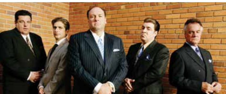
«سوپرانوز» (The Sopranos)

سرفت بزرگ و طولانی مدت است که هدایت و طراحی آن با مردی موسوم به پروفیسور (با بازی الوارو مورته) است که اولی در خزانه ثروت ملی اسپانیا صورت می گیرد و دومی در محل بانک مرکزی این کشور. ابتدا قناریود کار به صورت یک سریال محدود و حداکثر ۱۵ قسمتی ارائه شود اما غنای موضوع و نیاز به اپیزودهای بیشتر هم تعداد فیلم ها را بیشتر کرد و هم طول مدت آن را. ماجراها در مادرید خلق می شود. آنجا که سر دسته سارقان (پروفیسور) ۸ خلاقکار مجرب را استخدام می کند و به جای آوردن نام های حقیقی شان از اسم کشورهای دنیا برای فراخوان شان استفاده می کند تا لو نروند. اولین برنامه آنها سرقت ۲/۴ میلیارد یورو از خزانه