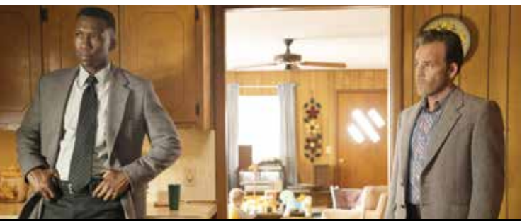
«کارآگاه حقیقی» (True Detective)

● ژانر: پلیسی و جنایی ● کمپانی‌های سازنده: انونیموس کانتنت، نئون بلک و برادران وارنر ● خالق: نیک پیژولاتو ● بازیگران اصلی: متیو مک کاناهای، وودی هارلسون، میشل موناهان، مایکل پاتس، کالین فارل، راشل مک آدامز، تیلور کیچ، ماهرشالا علی، استیفن دورف و اسکوت مک نیری ● موسیقی متن: تی، بون برنت ● تعداد فصل‌ها: ۳/ ● شمار اپیزودها: ۲۴ ● زمان بخش: از ژانویه ۲۰۱۴ تا فوریه ۲۰۱۹ ● موضوع: این یک سلسله داستان جنایی و پلیسی است و در هر فصل افراد تازه و ماجراهایی متفاوت به کار گرفته شده‌اند و محیط و شرایط تغییر یافته است. وقایع فصل اول که مک کاناهای و هارلسون ستاره‌های آن هستند، در ایالت لوئیزیانای آمریکا روی می‌دهد و تعقیب یک قاتل سریالی به مدت