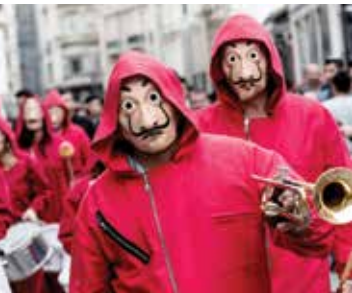
«سرقت پول» (money Heist)

● ژانر: دراماتیک، تخیلی و تاریخی ● کمپانی های سازنده: گروک و برادران وارنر ● خالقان: دیوید بنیوف و دی بی وایس، براساس رمانی از جورج آر آر مارتن ● بازیگران اصلی: شون بین، مارک آدی، نیکولای کاستر والدو، میشل فیبرلی، لنا هیدی، امیلیا کلارک، ایان گلن، کیت هرینگتون، سوفی ترنر و میسی ویلیامز ● موسیقی متن: رامین جوادی ● تعداد فصل ها: ۸/ ● شمار اپیزودها: ۷۳ ● زمان پخش: از آوریل ۲۰۱۱ تا مه ۲۰۱۹ ● موضوع: این مجموعه در درجه اول در ایرلند شمالی و بخش هایی دیگر از بریتانیا و در درجات بعدی در کشورهای همچون کانادا، کرواسی و ایسلند تصویربرداری شده و در متن داستان به سرزمین هایی خیالی به نام های وستروس و اسوس به عنوان محل شکل گیری اتفاقات اشاره شده است. در طول سریال چند قصه به طور همزمان ترسیم می شوند. یکی