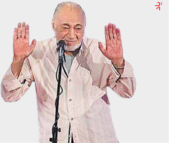
مسعود ولدبیکي پیشکسوت چهره‌پردازی سینمای ایران درگذشت