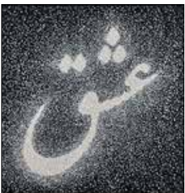
«عشق»، اثر هنری فرهاد مشیری، هنرمند معاصر ایرانی