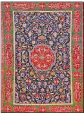
فرش ایرانی عهد صفویه با اشعار حافظ در حاشیه

می‌خورد. در ادامه و در بخش «تغییر ایمان» به ورود اسلام به ایران و نقش اسلام در آثار هنری این دوره پرداخته می‌شود. ظهور سلسله صفویه، گرویدن شاه عباس صفوی و اکثر ایرانیان به دین اسلام و مذهب شیعه، ایران را به کشوری چند فرهنگی تبدیل کرد. پدیده‌ای که به شکوفایی هنر و فرهنگ انجامید؛ رشد معماری، هنر و ادبیات از دستاوردهای این دوره است. این نقطه آغاز تاریخ مدرن در ایران به شمار می‌رود. قرآن‌های خطی به تذهیب و تشعیر مزین شدند و خوشنویسی و خطاطی عربی رواج بسیار یافت. در ادامه این نمایشگاه به بخش «تعالی ادبی» می‌رسیم که به رشد شعر فارسی توجه می‌کند. خطاطی که به شعر شاهد پیشرفت فراوان بود تا حدی که روی آثار هنری مختلف از جمله ظروف سفالی، ظروف نقره و حتی فرش دیده می‌شود. نمونه‌ای از آن بر فرشی متعلق به عهد صفویه دیده می‌شود که حاشیه‌هایش اشعاری از حافظ را در بر دارد. سپس به هنر دوران قاجار می‌رسیم. این بخش از نمایشگاه به ارتباط میان هنرمندان ایرانی و اروپایی و نیز تأثیر اروپا بر هنر و پوشش ایرانیان عهد قاجار می‌پردازد. بخش نهایی نمایشگاه متعلق به هنر معاصر ایران از سال ۱۹۴۰ تا به امروز است که در آن آثار هنرمندانی چون سیراک ملکونیان، پرویز تناولی، منیر فرمانفرمایان و بهمن محض به نمایش درآمده‌اند. در ادامه آثار نسل بعد هنرمندان معاصر ایرانی همچون فرهاد مشیری، شیرین نشاط، شادی قدیریان و وای ز کاسی به چشم می‌خورد. آثاری که شرایط معاصر ایران را به زبان هنر منعکس می‌کنند. بزرگداشت فرهنگ و هنر ایران زمین اتفاق ارزشمند و چشمگیری ست که در شرایط کنونی بسیار حائز اهمیت است هر چند ورای مرزهای کنونی سرزمین‌مان باشد.