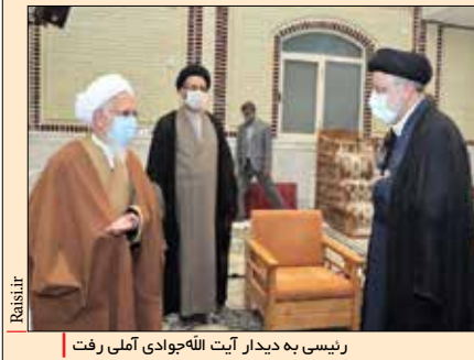
رئیس به دیدار آیت‌الله‌جوادی آملی رفت

را در نظر حضرت علی (ع) دو دوسته دانسته و اظهار داشت: حضرت اگر چه رفتار و کردار مردم کوفه را نکوهش می‌کنند، اما در نامه مهمی که به مالک اشتر می‌نویسم، مردم را همچون نماز ستون دین و شایسته خدمت بی‌منت معرفی می‌کنند. این مرجع تقلید در بخش دیگری از سخنانش با اشاره به آیاتی از قرآن کریم تصریح کرد: قرآن تأکید دارد که زیر بار هر صلیحی نباید رفت. برخی سازش‌ها هست که ظاهراً سازش، اما باطنش سوزش است و لذا به دستور قرآن نباید زیر بار آنها رفت.