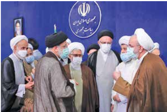
دیدار اعضای جامعه روحانیت مبارز با رئیس جمهوری

نقطه کلیدی یا محوری این سه جلسه را می‌توان در یک جمله خلاصه کرد؛ امیدواری نسبت به آینده، آن هم امید قطعی که بر واقع‌بینی و آگاهی نسبت به ظرفیت‌های کشور مبتنی است.