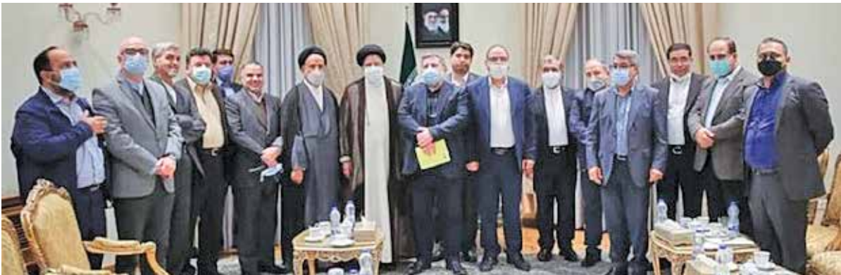
مدیران رسانه های اصلاح طلب چهارشنبه با رئیس جمهوری دیدار کردند

اما گذشته از این تعبیر اخلاقی، این دیدارها معنای دیگری نیز دارد. نشست با گروه‌های سیاسی، از طیف‌ها و جریان‌های سیاسی کشور، نشان می‌دهد که رئیسی به گروه‌ها، نخله‌ها و چهره‌های سیاسی، نگاهی فراگیر و ورای گروه بندی‌های رایج دارد. پیوندها و ارتباطات او، صرفاً موقوف به یک جریان سیاسی خاص نخواهد بود، بلکه تلاش دارد تا از طریق نشست و برخاست با گروه‌هایی که به نوعی غیرهمسو با دولت محسوب می‌شوند، آن دیدگاه‌ها، افکار و نقطه نظرات متنوع موجود در جامعه مطلع شود. درعین حال می‌توان گفت ملاقات کنندگان نیز در گفت‌وگویی مستقیم و بی‌واسطه، هم نقطه نظرات خود را به رئیس جمهوری انتقال دهند و هم از دیدگاه‌های وی مطلع شوند؛ امری که می‌تواند در اصلاح جهت‌گیری‌ها و بهبود داوری‌های سیاسی، اجتماعی و رسانه‌ای آنان مؤثر باشد و به نوعی، پیشداوری‌های ایجاد شده در دوران انتخابات با پس از آن را تصحیح کند. هرچند تجمیع همه نظرات حاضران در این نشست‌ها و به کار بستن همه ایده‌هایی که در حضور رئیس جمهوری مطرح می‌شود عملاً ممکن نیست، اما این نشست‌ها می‌تواند باعث گسترش همدلی و انسجام اجتماعی و سیاسی شده، دیدگاه‌ها را به هم نزدیک‌تر کرده، سبب افزایش اعتماد میان جریان‌های سیاسی شده، فعالان سیاسی و رسانه‌ای را نسبت به مقاصد و دیدگاه‌های رئیس جمهوری مطلع کند. درنهایت رئیس جمهوری نیز از خلال این گفت‌وگوها، به صورت مستقیم درمی‌یابد که جریان‌های مختلف یا گروه بندی‌های اجتماعی