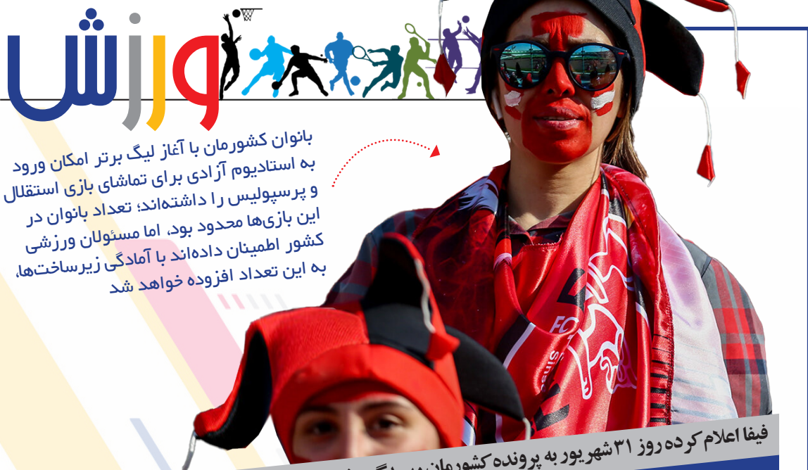
فیفا اعلام کرده روز ۳۱ شهریور به پرونده کشورمان رسیدگی خواهد شد