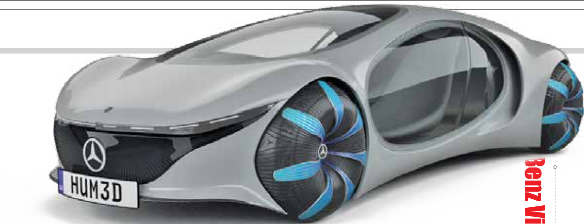
Benz Vision AVTR