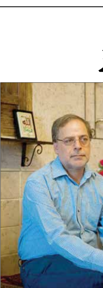
علی مصدق / ایران

مردی آشنا می‌شویم که بین سال‌های ۱۹۶۵ تا سال ۲۰۱۰ که فوت کرد هیچ داستانی منتشر نکرد اما همه او را بزرگترین نویسنده زنده زمین می‌دانستند.