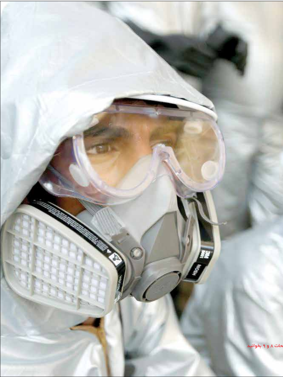
در صفحات ۸ و ۹ بخوانید

لحاظ شوری که در سال جاری این رقم حدود دو برابر شده است. همچنین یک‌هزار و ۳۰۰ میلیارد تومان نیز برای بیمه تکمیلی بازنشستگان در نظر گرفته شده است. وی یادآور شد که به‌زودی با حضور نمایندگان تشکل‌های ذی‌ربط در بخش بهداشت و درمان مشکلات و کمبودهای این بخش بررسی و تصمیم‌های لازم اتخاذ خواهد شد. //ایرنا