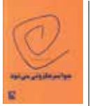
حواسم حزنونی می شود ترکس میرده