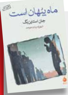
ماه پنهان است جان استاین‌بک شهرزاد بیات‌موحد

جنگ یعنی خیانت، نفرت، خرابکاری‌های فرماندهان نالایق، شکنجه، کشتار، بیماری وخستگی و جز این نیست تا سرانجام به پایان برسد. تازه بعد هم هیچ چیزتغییر نمی‌کند مگرنفرت‌هاوخستگی‌های تازه که جایگزین همتایان کهنه‌شان می‌شوند.