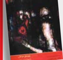
تنهایی پر هیاهو بهومیل هر ابال ترجمه: پرویز دوابی نشر: کتاب روشن

سی‌وینچ اسالت که در کار کاغذ باطله هستم واین «قصه عاشقانه» من است. سی‌وینچ اسالت که دارم کتاب و کاغذ باطله خمیر می‌کنم و خود را چنان با کلمات عجین کرده‌ام که دیگر به هیأت دانشنامه‌هایی درآمده‌ام که طی این سال‌ها سه‌تنی از آنها را خمیر کرده‌ام.