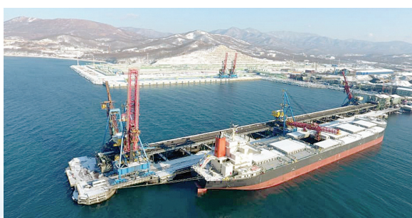
مقادیر ۴۰/۵ هزار تن برنج، ۱۱۶/۲ هزار تن روغن خام و ۳۰۵ هزار تن شکر خام از منابع بازارهای جهانی خریداری و وارد کشور شده است.