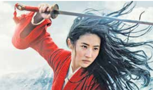
صحنه‌ای از فیلم رزمی و پرمجرای «مولان»، یکی از پرفروش‌ترین آثار این هفته سینماهای جهان

تنها فیلم جدیدی که این هفته اکران وسیع شد و به‌رغم گرفتن نمره تأییدآمیز ۸۱ درصد از سایت ارزشگذاری روتن توماتوز مثل سایر فیلم‌های روز زورش به «تنت» نرسید، کاری این فیلم کمدی – رومانتیک که کاری از داکری موننگری است، این هفته در ۲۲۰۵ سالن در سطح آمریکای شمالی به نمایش درآمد و با اینکه تم شیرین و خوشبینانه آن در تعارض با مضمون سنگین و تلخ اکثر فیلم‌های به‌نمایش درآمده در عصر بازگشایی سالن‌ها پس از تخفیف نسبی دشواری‌های کرونا است، اما برای رسیدن به تنت و غلبه بر آن کم آورد و به رتبه