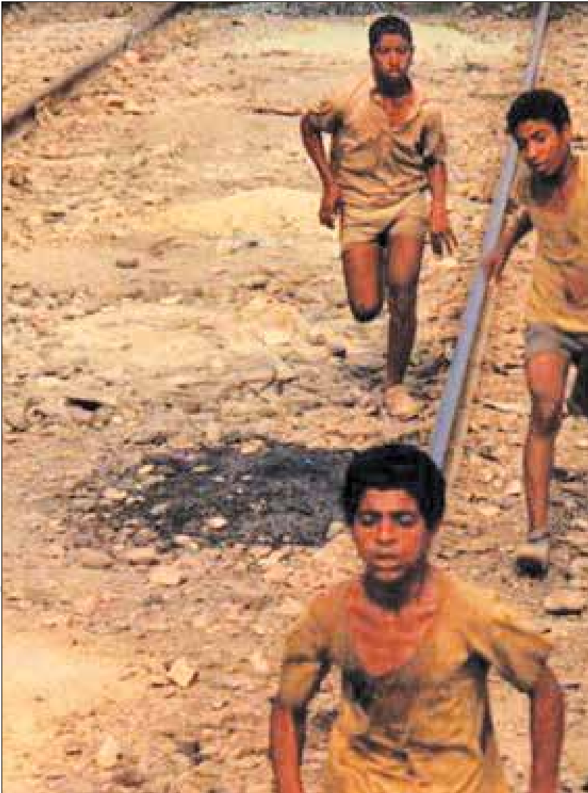
نمایی از فیلم «خود» ساخته امیر نادری

کارگردان «رابطه» و «پرنده کوچک خوشبختی» بی‌مهری نسبت به این آثار در اکران را از عوامل دلسردی فیلمسازان و به تبع آن کم رونق شدن سینمای کودک می‌داند: «در دوره‌ای اکرانی برای فیلم‌های کودک نداشتیم؛ فیلم‌های خود من به