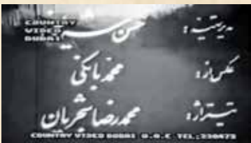
تیتراژ فیلم «قالب»