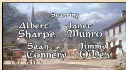
ظاهر شدن اسم شان کانری در تیتراژ فیلم‌های اولیه‌اش روند معهودی دارد ■

آن تصویری که شان کانری ۸۷ ساله را سالخورده، با عصا، زانوانی خمیده و همراه یک پرستار مرد نشان می‌داد، هم تکان دهنده بود و هم نسبتی با جذابیت و شادابی این بازیگر در سال‌های دور نداشت. بی‌سویی و حیرانی نگاهش هم بیشتر نگران‌مان می‌کرد و به نوعی بی‌حواسی و فراموشی هم راه می‌داد. به نظر می‌رسید خداحافظی دو سال قبل‌تر او از دنیای بازیگری به بهانه نوشتن کتاب زندگینامه، علت‌های دیگری هم دارد. عوارض ناشی از یک جراحی و زوال عقل که کانری در سال‌های پایانی عمرش با آن درگیر بود، کار جیمزباند پیر را ساخته بود، اما چه باک که او پیش از این، بارها خاطره‌سازی کرده بود و برای همیشه یکی از شمایل‌های سینماست.