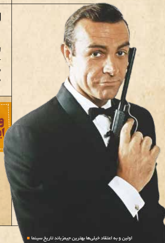
اولین و به اعتقاد خیلی‌ها بهترین جیمزباند تاریخ سینما ■

ایران جمعه شماره ۲۷ دوره جدید (ضمیمه آخر هفته روزنامه ایران)