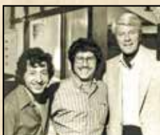
■ نفر سمت راست پیتر گریوز ■ نفر سمت چپ رضا بدیعی

رضا بدیعی، کارگردانی چند قسمت از این سریال مشهور را به عهده داشت؛ سریالی که یکی از نقش‌های اصلی آن را پیتر گریوز بازی می‌کرد که پیش از این با بازی در فیلم‌های شب شکارچی و بازداشتگاه شماره ۱۷ شهرتی به دست آورده بود.