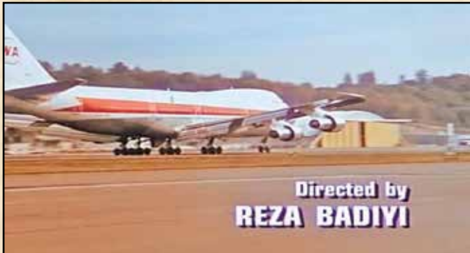
■ رضا بدیعی کارگردان چند قسمت از سریال «مرد شش میلیون دلاری» بود

جهان داشته باشد. شاید در این سال‌ها تنها بتوان از فیلمبردار ایرانی تباری چون داریوش خنجی نام برد که او هم گزیده‌کار است و در پرکاری حرفه‌ای، با کارنامه بدیعی فاصله دارد. ساخت آثار فراوان و نقش مهم بدیعی در مجموعه‌های تلویزیونی، باعث شده بود به او لقب پدرخوانده تلویزیون آمریکا را بدهند. بدیعی که متولد ۲۸ فروردین ۱۳۰۹ در اراک بود، ۳۱ مرداد ۱۳۹۰ و در ۸۱ سالگی در لس آنجلس درگذشت.