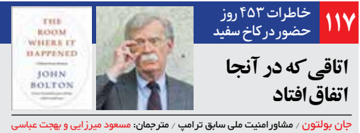
جان بولتون / مشاور امنیت ملی سابق ترامپ / مترجمان: مسعود میرزایی و بهجت عباسی