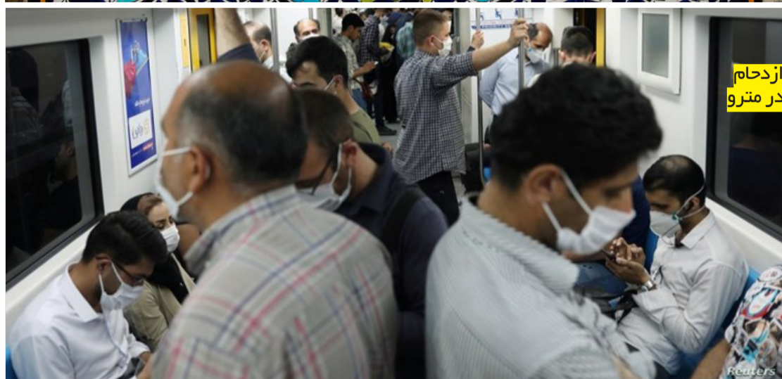
ازدحام در مترو

«ایران» از اولین روز اعمال محدودیت‌های جدید گزارش می‌دهد