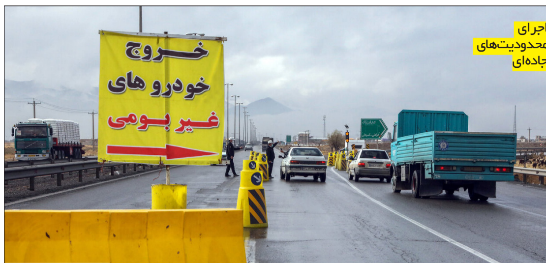
اجرای محدودیت‌های جاده‌ای