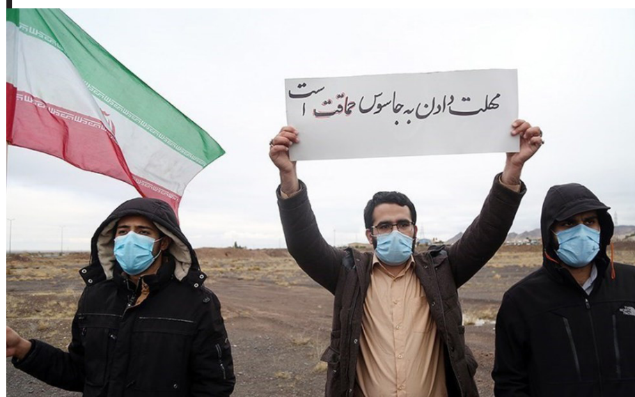
تعدادی از دانشجویان دانشگاه امام صادق (ع) امروز با تجمع در مقابل سایت هسته‌ای فردو خواستار راه‌اندازی این مجتمع غنی‌سازی شدند

پاسخ دولت چیست، تصریح کرد: «در خصوص سانتریفیوژها دو نکته را باید اضافه کنیم؛ یکی اینکه این اقدامات در چارچوب برجام و حقوق مندرج در آن برای طرفین انجام می‌گیرد و دیگر اینکه همان‌طور که بارها گفته‌ایم تمام اقدامات ما برگشت‌پذیرند و هر زمان که امریکا به تعهداتش