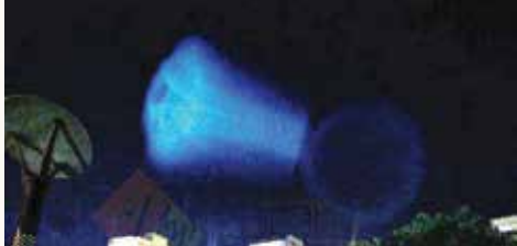
تصویری از آسمان ایران (تهران) در ۱۸ خرداد ۱۳۹۱

ساعت ۲۲:۱۸: یکشنبه [۱۸ خرداد ۱۳۹۱] یک شیء نورانی در شهرهایی از جمله تهران، تبریز، همدان، شیراز، کرج، اردبیل، طبرس، کرمانشاه، شاهرود، مشهد، بروجرد، مهاباد و... دیده شد. این شیء که در زمان حرکت در آسمان دود ابرمانندی به شکل بشقاب پرنده را بر جای می گذاشت، پس از دقایقی از آسمان محو شد. همچنین رسانه‌های بین‌المللی خبر دادند این شیء در کشورهای منطقه از جمله جمهوری آذربایجان، سوریه، ارمنستان، لبنان، قزاقستان، قبرس، اردن و سرزمین‌های اشغالی نیز مشاهده شده است. این پدیده شبیه یک جسم مخروطی شکل در ارتفاع بالا، نورسفیدی را از خود به جای گذاشته و از غرب به شرق در حرکت بوده و به مدت ۳ دقیقه رؤیت شده است.