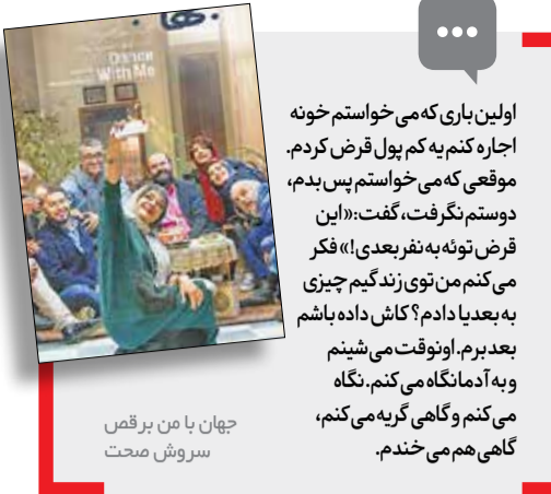
جهان با من برقص سروش صحت

● سالروز درگذشت آندره ژید نویسنده فرانسوی، امبرتو کوکونشانه شناس ایتالیایی، هارپر لی نویسنده آمریکایی، جان فرانکن هایسر فیلمساز آمریکایی و ابراهیم فخر بازیگر هم امروز است.