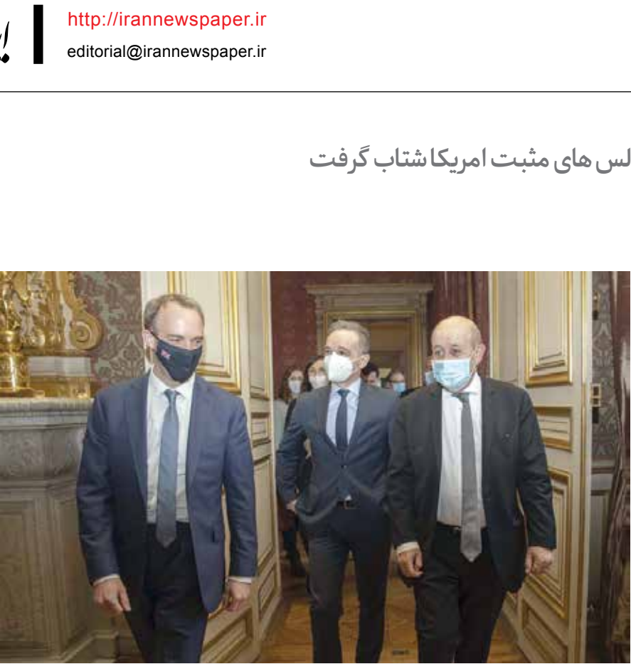
وزرای خارجه آلمان، انگلیس و فرانسه در پاریس و با حضور تصویری همتای امریکایی درباره برجام گفت‌وگو کردند