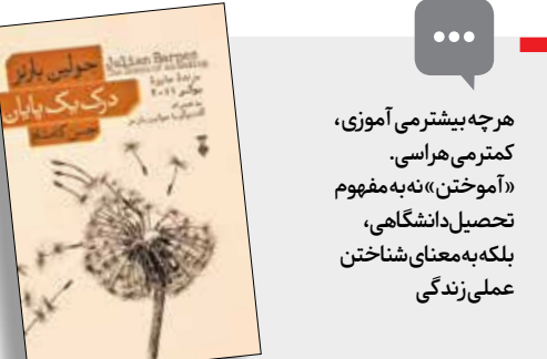
درک یک پایان