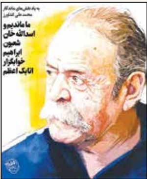
شعبان استخوانی رفت «محمدعلی کشاورز» بازیگر برجسته سینما، تئاتر و تلویزیون روز ۲۵ خرداد ۱۳۹۹ در گذشت روزنامه ایران- دوشنبه ۲۶ خرداد ۱۳۹۹