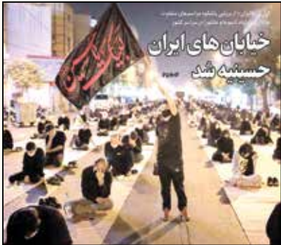
خیابان های ایران حسینیه شد برپایی پاشکوو مراسم عزاداری در ایام تاسوعا و عاشورا در سراسر کشور روزنامه ایران- دوشنبه ۱۰ شهریور ۱۳۹۹