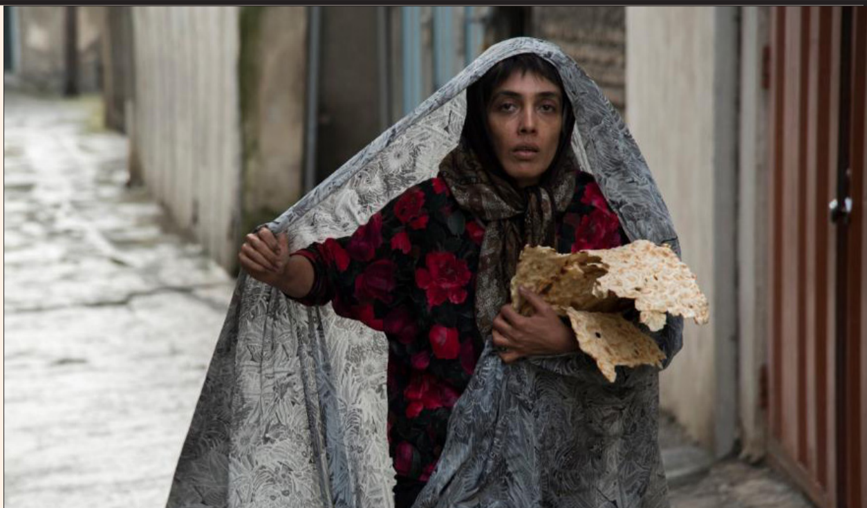
موج جدید کرونا، گیشه را شکست داد