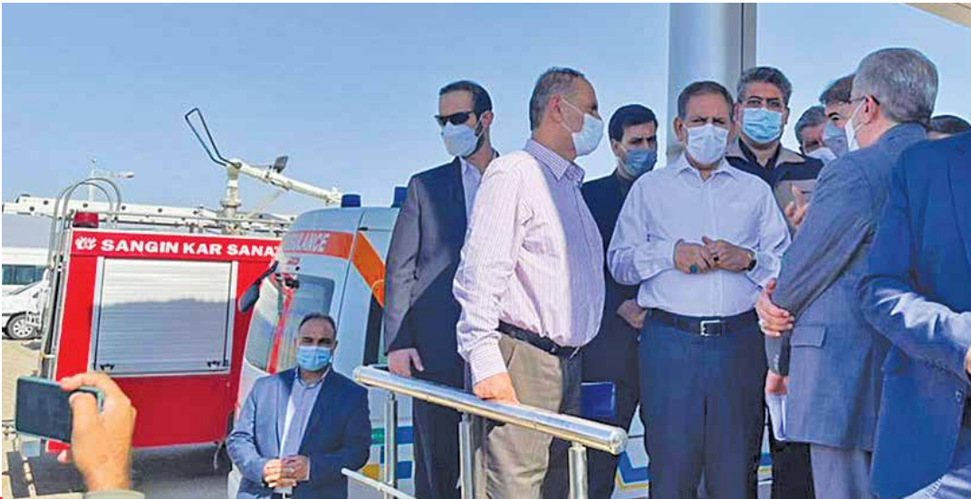
جهانگیری بعداز ورود به خوزستان، بلافاصله از سد کرخه بازدید کرد |

■ شنبه ۲ مرداد ۱۴۰۰ ■ سال بیست و هفتم ■ شماره ۷۶۸۳