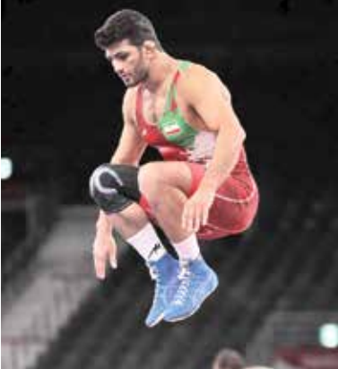
حسن یزدانی برای دومین طلای المپیکش، امروز با تیلور سرشاخ می‌شود |

۵-۱ به برتری رسید و گام به مرحله نیمه‌نهایی گذاشت. اطری در مرحله نیمه‌نهایی برابر «زاوور اوگوف» دارنده دو طلای مسابقات قهرمانی جهان در سال‌های ۲۰۱۸ و ۲۰۱۹ از کمیته المپیک روسیه قرار گرفت و ۸-۳ شکست خورد تا اول و در مرحله یک‌هشتم نهایی با «جاوایل شاپیف» از ازبکستان مبارزه کرد و ۱۱-۲ به برتری دست یافت و گام به مرحله یک‌چهارم نهایی گذاشت. قهرمان المپیک ۲۰۱۶ ریو در دیدار بعدی برابر «استفان ریچموت» از سوئیس قرار گرفت و در حالی که در همان ثانیه‌های ابتدایی از حریف عقب افتاد، اما در کمتر از ۲ دقیقه حریفش را ۱۲-۱ مغلوب کرد و با اقتدار راهی نیمه‌نهایی شد. یزدانی در مرحله نیمه‌نهایی به مصاف «آرتور نایفانوف» از کمیته المپیک روسیه رفت و به پیروزی ۷-۱ دست یافت و راهی فینال شد. یزدانی ظهر امروز در فینال به مصاف دیوید تیلور از آمریکا خواهد رفت. در صورتی که پولنورز (لقبی که اتحادیه جهانی کشتی به یزدانی داد) در فینال پیروز شود و به مقام قهرمانی برسد، نخستین کشتی‌گیر ایرانی خواهد بود که دو مدال طلا در المپیک به خود اختصاص می‌دهد. تیلور تاکنون دو مرتبه در رقابت‌های جام جهانی کرمانشاه و مسابقات جهانی ۲۰۱۸ بوداپست موفق به شکست حسن یزدانی شده و طرفداران کشتی در جهان بی‌صبرانه منتظر دیدن این رقابت حساس و تماشایی هستند. همچنین رضا اطری در وزن ۵۷ کیلوگرم کشتی آزاد نخستین مبارزاش را برابر «سلیمان آتلی» از ترکیه، دارنده مدال‌های نقره و برنز جهان و قهرمان اروپا در سال ۲۰۲۱ برگزار کرد و ۲-۳ به برتری رسید و گام به مرحله یک‌چهارم نهایی گذاشت. اطری در این مرحله به مصاف «پخیاپار اردن بات» از مغولستان رفت و برابر این آزادکار