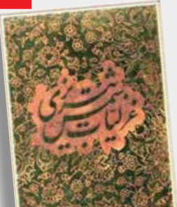
شعری از مولانا غزلیات شمس

ای یوسف خوش نام ما خوش می‌روی بر بام ما ای در شکسته جام ما ای بردریده دام ما ای نور ما ی سور ما ای دولت منصور ما جوشی بنه در شور ما تامی شود انگور ما