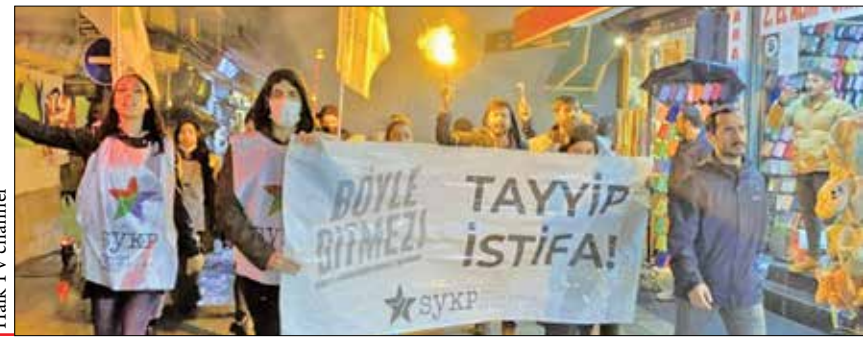
Halk TV channel

در پی سقوط ارزش لیر، خیابان‌های شهرهای بزرگ ترکیه شاهد اعتراض‌های مردمی بود