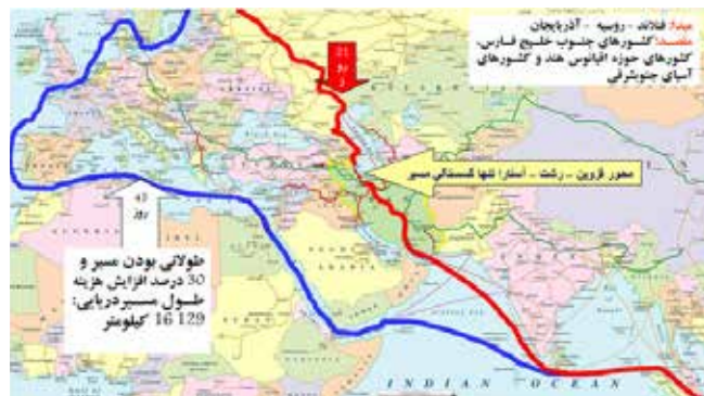
تصویر ۷- کریدور شمال-جنوب (قرمز رنگ)

البته منطق قرارداد سوآپ گازی ایران ذیل مقابله با کریدور ترانزیتی لاچورد نیز تعریف می‌شود (تصویر ۳). مجید شاکری اقتصاددان درباره مزایای استراتژیک این قرارداد سوآپ گازی می‌گوید: انصافاً منطق قرارداد سوآپ گاز از ترکمنستان به آذربایجان خیلی دقیق تنظیم شده است. موضوع صرفاً تأمین یا عدم تأمین گاز پنج استان شمالی ایران نیست بلکه ایران دریچه‌ای ایجابی برای همکاری با محور