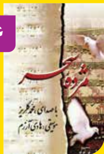
■ سال تولید: ۱۳۷۸ ■ خواننده: محمد گلریز ■ آهنگساز: احمدعلی راغب ■ موسیقی: هادی آزمون

این آلبوم که در حیطه موسیقی ایرانی ارائه شده است هشت آهنگ را دربرمی‌گیرد که «پیش درآمد»، «دولت بیدار»، «تصنیف ماه رخ دوست»، «تصنیف گلشن مقصود»، «ساز و آواز»، «دل شیدا» و... برخی از این قطعات به شمار می‌روند. گلریز در همکاری که در این آلبوم با هادی آزمون داشت، این قطعات را به سبک موسیقی اصیل ایرانی خواند. این آلبوم از سوی انتشارات سروش منتشر شده است.