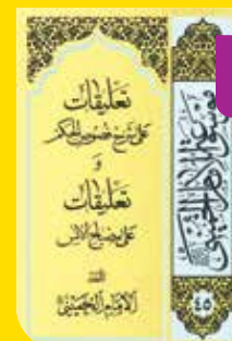
■ امام خمینی ■ عربی

مفتاح غیب الجمع والوجود تألیف صدرالدین محمدبن اسحاق قونوی و شرح آن به نام مصباح الانس تألیف محمدبن حمزه بن محمد عثمانی معروف به ابن فناری است. امام خمینی مصباح الانس را تا صفحه ۴۴ از سال ۱۳۵۰ تا ۱۳۵۴ قمری نزد مرحوم آقای شاه آبادی خوانده است. تعلیقہ علی شرح حدیث راس الجالوت شرح حدیث راس الجالوت و سیر سوره حمد از دیگر آثار امام در زمینه عرفان، اخلاق و فلسفه است.