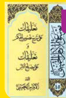
■ امام خمینی ■ عربی

فصوص الحکم تألیف محیی الدین عربی و شرح آن از محمود قیصری است و امام خمینی شرح فصوص را در هفت سالی که از محضر مرحوم شاه آبادی استفاده می کردند، نزد ایشان خوانده و تاریخ تألیف این تعلیقہ ہم همان سال هاست. این تعلیقہ را حضرت امام خمینی در حواشی نسخه چاپی شرح فصوص نوشته بودند و پس از پیروزی انقلاب اسلامی توسط موسسه تنظیم و نشر آثار امام منتشر شد.