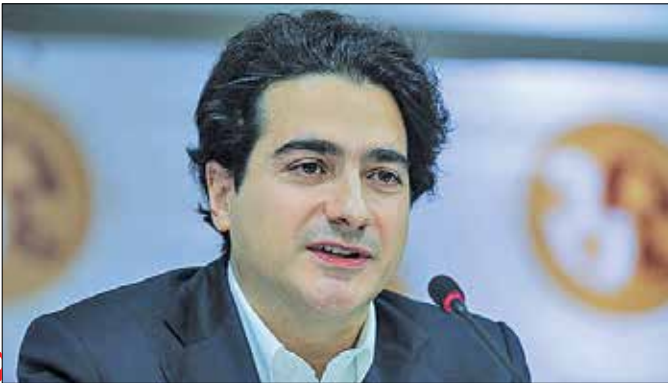
روابط عمومی پروژ «سی»