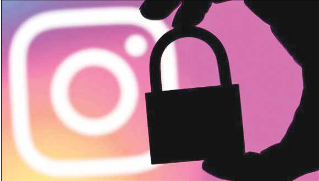
طرح: فضای مجازی

«ایران» از دلایل موافقان و مخالفان مسدودسازی شبکه های اجتماعی گزارش می دهد