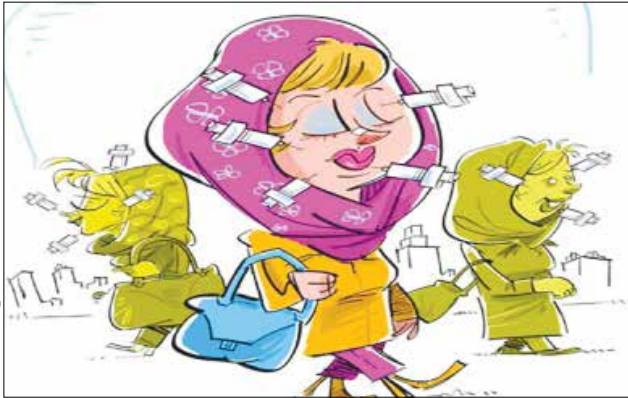
طرح: فضای مجازی

درست زمانی که یک خانواده برای دورهمی‌هایشان تصمیم گرفتند به پارکی در حوالی لواسان بروند بی خبر از آنکه دو سگ پتی بول و ژرمن شیرد در کمین آنها نشستند است. پس از حمله این دو سگ وحشی به بهار کودک ۱۰ساله بود که این موضوع دوباره مورد توجه کارشناسان قرار گرفت. مخصوصاً وقتی که پدر و خانواده این کودک اعلام کردند که حمله این دو سگ باعث پاره شدن ۱۵ سانتیمتر از پوست این کودک و قله‌وه‌کن شدن پاهای او شده اما با وجود این، فرد خاطی به همراه سگ‌هایش با در فضا مجازی عمل می‌کردند. بر اساس اعلام انجمن جراحان پلاستیک و بازسازی آمریکا بیش از ۲۳۶ هزار جراحی‌های زیبایی مانند جراحی بینی، تغییر مدل گوش‌ها، بزرگ کردن سینه، از بین بردن جای آکنه یا رخم در سن ۱۹ سالگی یا کمتر از این سن انجام شده است.