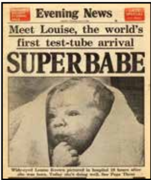
خیر تولد لوئیزی براون، اولین فرزند IVF جهان

همچنین در همین زمان زن دیگری به نام زهرا میرلوحی ۲۵ ساله که پس از ۱۳ سال نازایی و با روش فوق حمله شده بود، با عمل سزارین در مرکز پزشکی افشار، فرزند دختری به دنیا آورد که حال او رضایت بخش است. این نوزاد که ۳ کیلو و ۵۰۰ گرم وزن دارد، و جیه نامگذاری شده است.