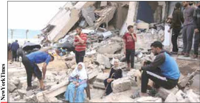
New York Times

۴۸ مدرسه اسکان داده شده‌اند اما بحران آب، غذا و دارو در این منطقه در پی تخریب زیرساخت‌های اساسی نوار غزه و فلسطین شد که آمریکا به‌رغم کارشکنی و حمایت از اقدامات رژیم صهیونیستی، برای صدور قطعنامه شورای امنیت سازمان ملل درباره فلسطین تحت فشار بین‌المللی قرار دارد. به گزارش شبکه خبری «الجزیره»، بامداد دیروز مناطق مختلف نوار غزه در شرق و شمال با ۶۲ جنگنده و ده‌ها موشک هدف حمله قرار گرفت و شمار کودکان شهید فلسطینی به دست کم ۶۱ نفر رسید. در مقابل مقاومت فلسطین نیز در چندین نوبت شهرهای تل آویو، سدیروت، عسقلان و دیگر مناطق اراضی اشغالی را موشک باران کردند. در جریان حملات بامدادی سه‌شنبه، اسرائیل دفتر صلیب سرخ قطر را نیز با موشک‌هایی هدف گرفت. در پی این حمله سازمان صلیب سرخ در توییچ با انتقاد از این اقدام اسرائیل، بر لزوم احترام بر قوانین حقوق بشری بین‌المللی برای تیم‌های امدادرسان تأکید کرد. وزیر خارجه قطر نیز ضمن محکوم کردن این اقدام گفت: «هدف گرفتن مؤسسات رسانه‌ای و حقوق بشری نقض آشکار حقوق بشر و استانداردها و ارزش‌های بین‌المللی است.»